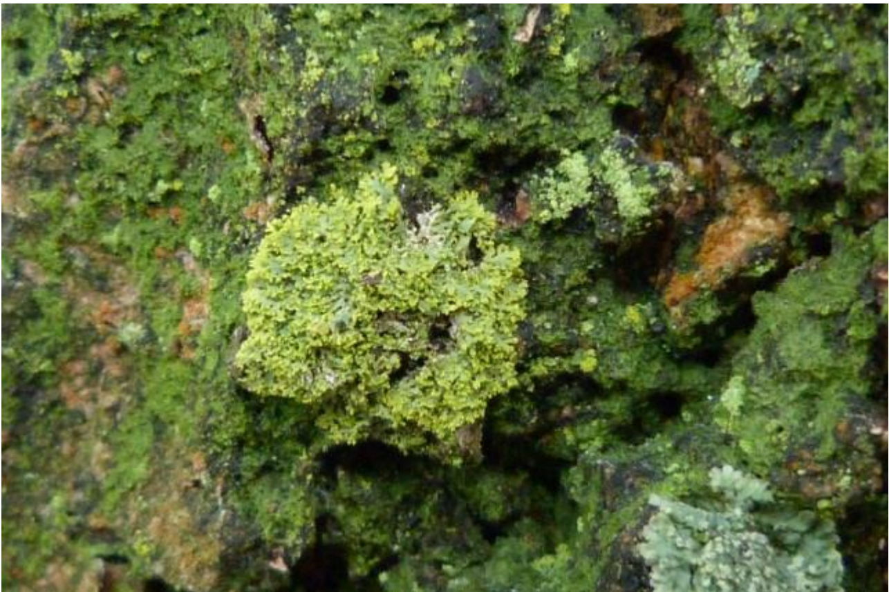
Kroezig dooiermos lijkt wel een miniversie van boerenkool