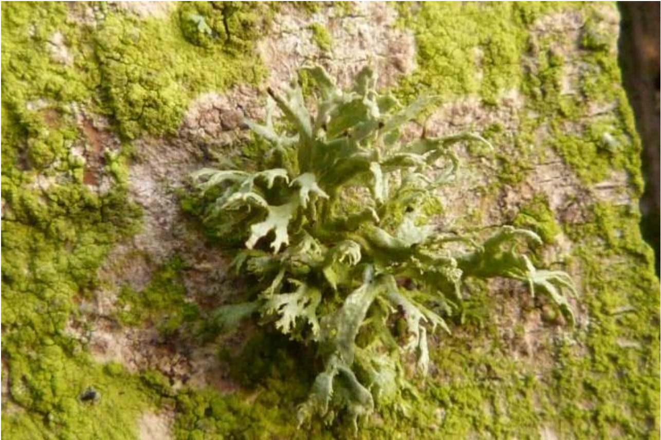
Een leuke verschijning dat eikenmos